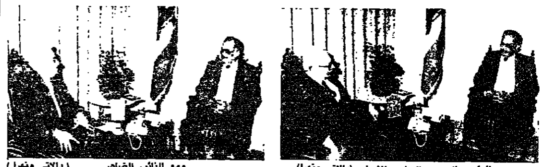
الرئيس الحصن والسفير مانشيني (اليمين) والرئيس الضاهر (اليسار) والوزير جبارة (الوسط) في اجتماعهم في بيروت.